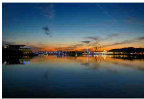
「グラデーションの空の 下のイルミネーション」 柴田善史 さん (撮影場所：ラグーナテンボス)