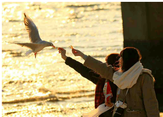
「どっちにしようかな？」