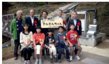
（四谷地区小水力発電完成式）