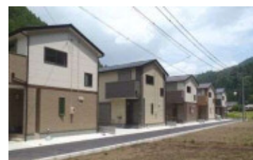
（豊根村・若者向け住宅の整備）