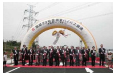
(国道23号豊橋東バイパス開通式)