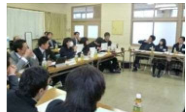
(ミライカフェほの国(高校生))