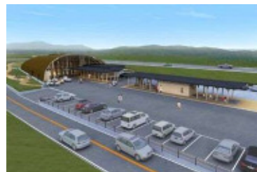
（「もっくる新城」完成予想図）