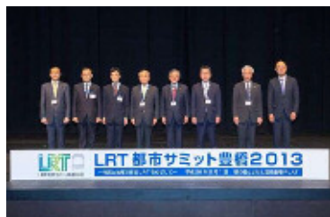
（LRT都市サミット豊橋2013）