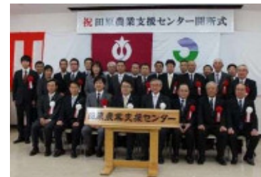
(田原農業支援センター開所式)