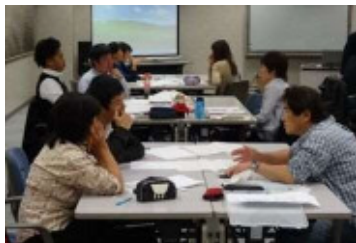
(6次産業化育成講座)