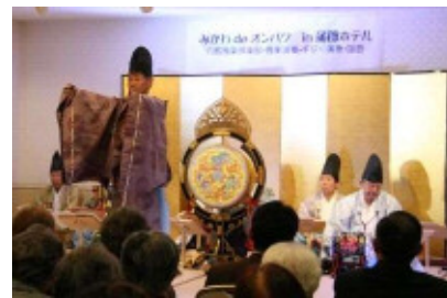
(みかわ de オンパク (雅楽演奏と舞))