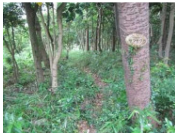
(同税を活用した里山林整備事業地)