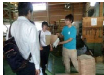
(東三河の大学生インターンシップ)