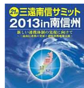
(三遠南信サミット開催ちらし)