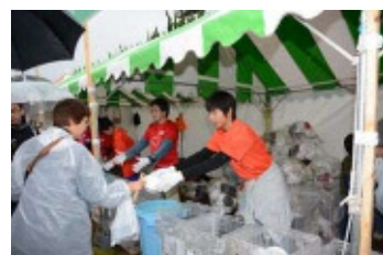
(B-1でのボランティア活動)