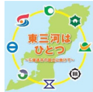
(パンフレット 東三河はひとつ)