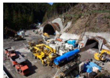
(三遠南信自動車道の整備(東栄町内))