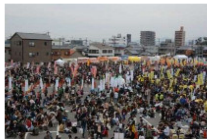
(B-1 グランプリ in 豊川)