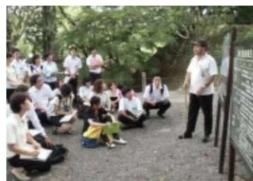
（宿泊研修（地域の教育資源見学））