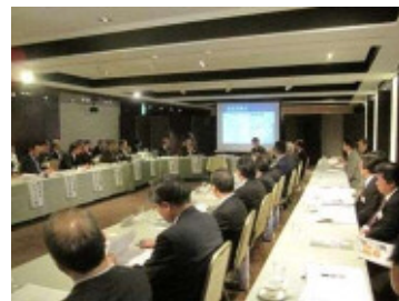
（東三河5市企業連携懇談会）