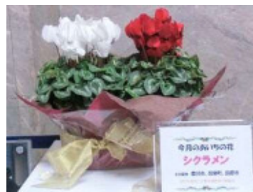
(12月のあいちの花「シクラメン」)