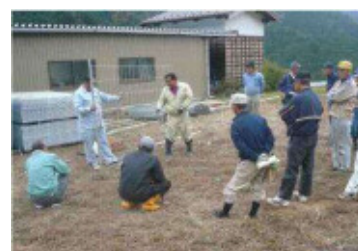
(設楽町での柵設置講習会)