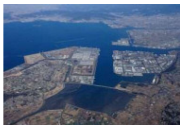
（国際的な自動車港湾の三河港）