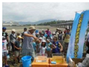
(蒲郡市竹島海岸における調査活動)