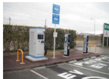
（豊橋市内に設置されたEV充電器）