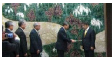
（県知事と東三河首長等との面談）