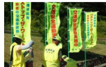
（交通安全啓発活動）