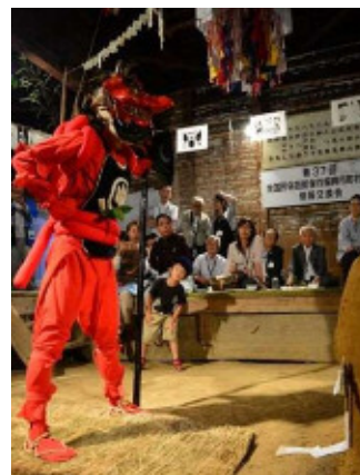
(全民連総会で披露された花祭の舞)