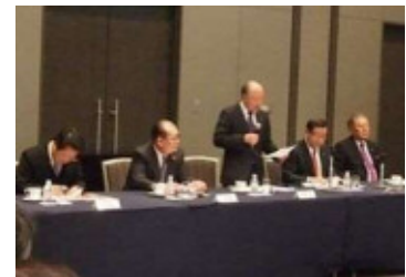
(東三河広域経済連合会全体会議)