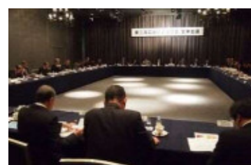
（東三河広域経済連合会全体会議）