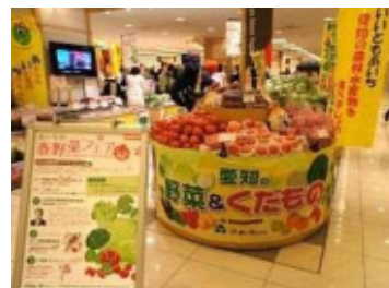
(あいちの春野菜フェア)