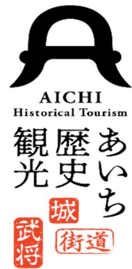
「あいちの歴史観光推進協議会」 ロゴマーク