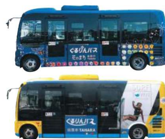
田原市ぐるりんバス