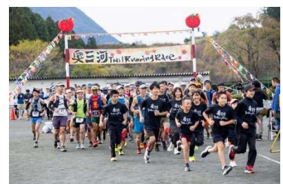
奥三河 Trail Running Race