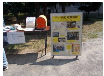
ペット同行避難訓練（豊橋市）