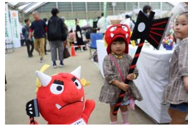
東栄フェスティバル