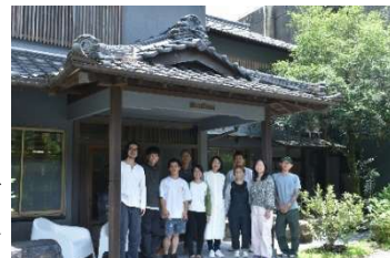
あいちの山里アントレワーク実践者