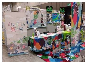
ふるさと回帰フェア

○大都市の企業・個人に向けて合同移住イベントの実施や定住・移住アドバイザーの活用等による関係人口の創出、移住定住を促進しました。【市町村、県】