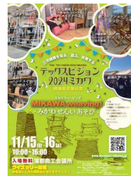
テックスビジョンチラシ