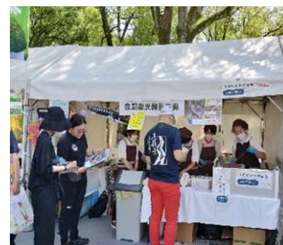
ふるさと全国県人会まつり 2024