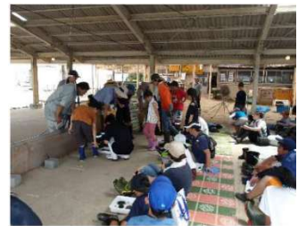
三河湾環境再生体験会