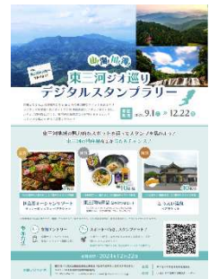
「東三河ジオ巡りデジタルスタンプラリー」チラシ