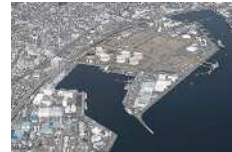
太陽光発電と大型蓄電池によるマイクログリッド（静岡県静岡市）

2030年度までに民生部門の電力消費に伴うCO 2 排出実質ゼロを実現するにあたり、デジタル技術も活用して脱炭素化に取り組み、地域課題の解決につなげる地域づくりを目指す。