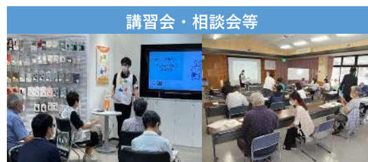
令和3年度デジタル活用支援推進事業（総務省）における講習会等の様子