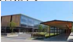
スマートシティAiCT（福島県会津若松市）