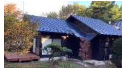
ワーケーション可能な農泊施設（イメージ）

中山間地域の基幹産業である農林漁業の「仕事づくり」を軸として、豊かな自然、魅力ある多彩な地域資源・文化等やデジタル技術の活用により、活性化を図る地域づくりを目指す。