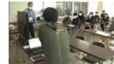
データを活用したスマート農業の取組（高知大学）

地域産業・若者雇用の創出や、地元企業や地方公共団体と連携した地方大学の取組を促し、大学を核として地方活性化が図られるような地域づくりを目指す。